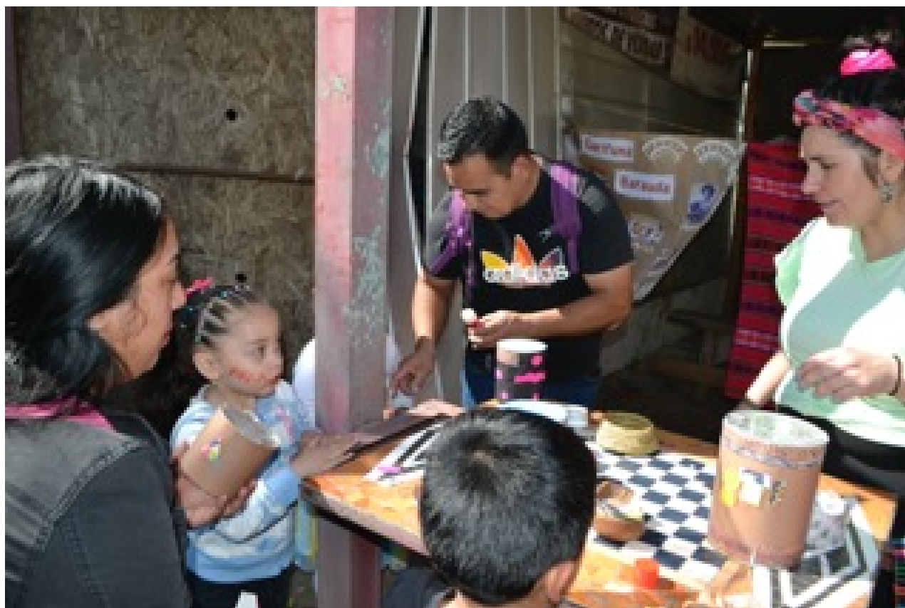
Ceremonia en Parque Ceremonial Mapuche

En el mes de septiembre, para la de Fiestas Patrias como es tradición, celebramos en la calle. Se presentaron danzas de tres zonas del país. Lo hermoso de esta instancia es que la comunidad circundante también disfruta del evento.