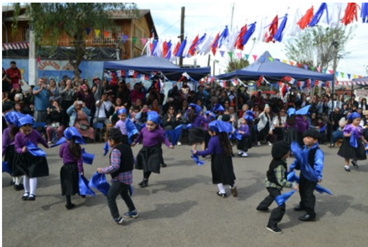
Celebración de Fiestas Patrias

En el mes de septiembre, para la de Fiestas Patrias como es tradición, celebramos en la calle. Se presentaron danzas de tres zonas del país. Lo hermoso de esta instancia es que la comunidad circundante también disfruta del evento.