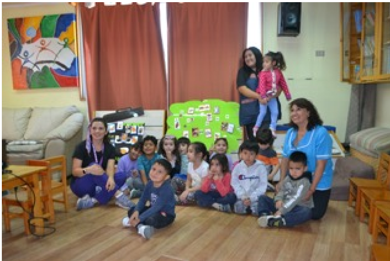
Programa sembrando sonrisas