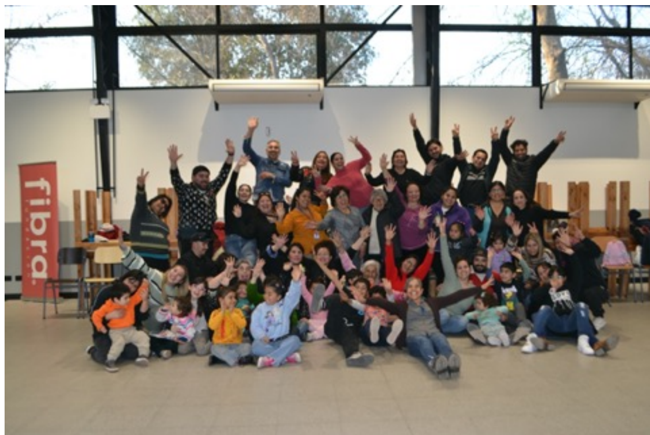
Taller de agentes de prevención psicosocial 3