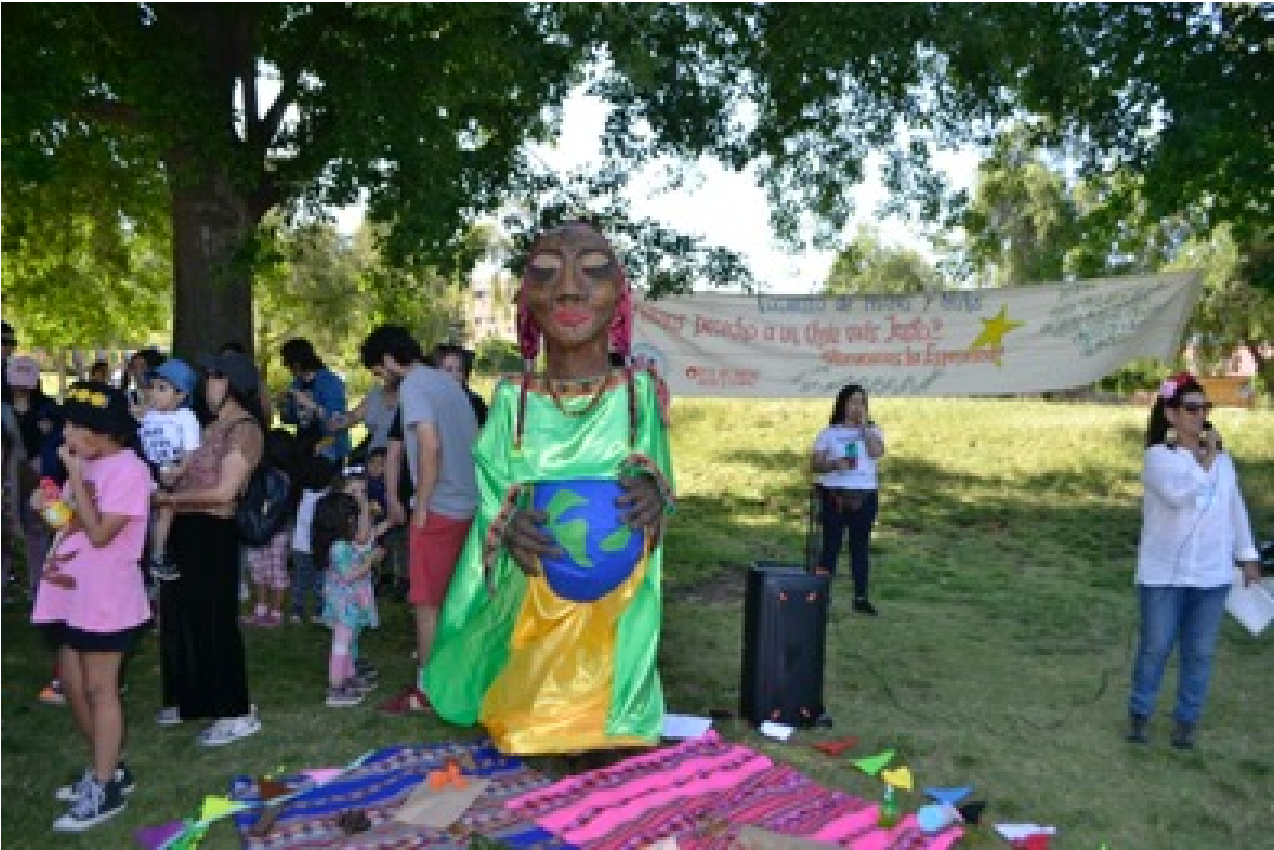
Encuentro en La Bandera

Cada jardín preparó un espacio con las temáticas de medio ambiente o paz, niños y niñas con sus familias pudieron recorrer y participar.