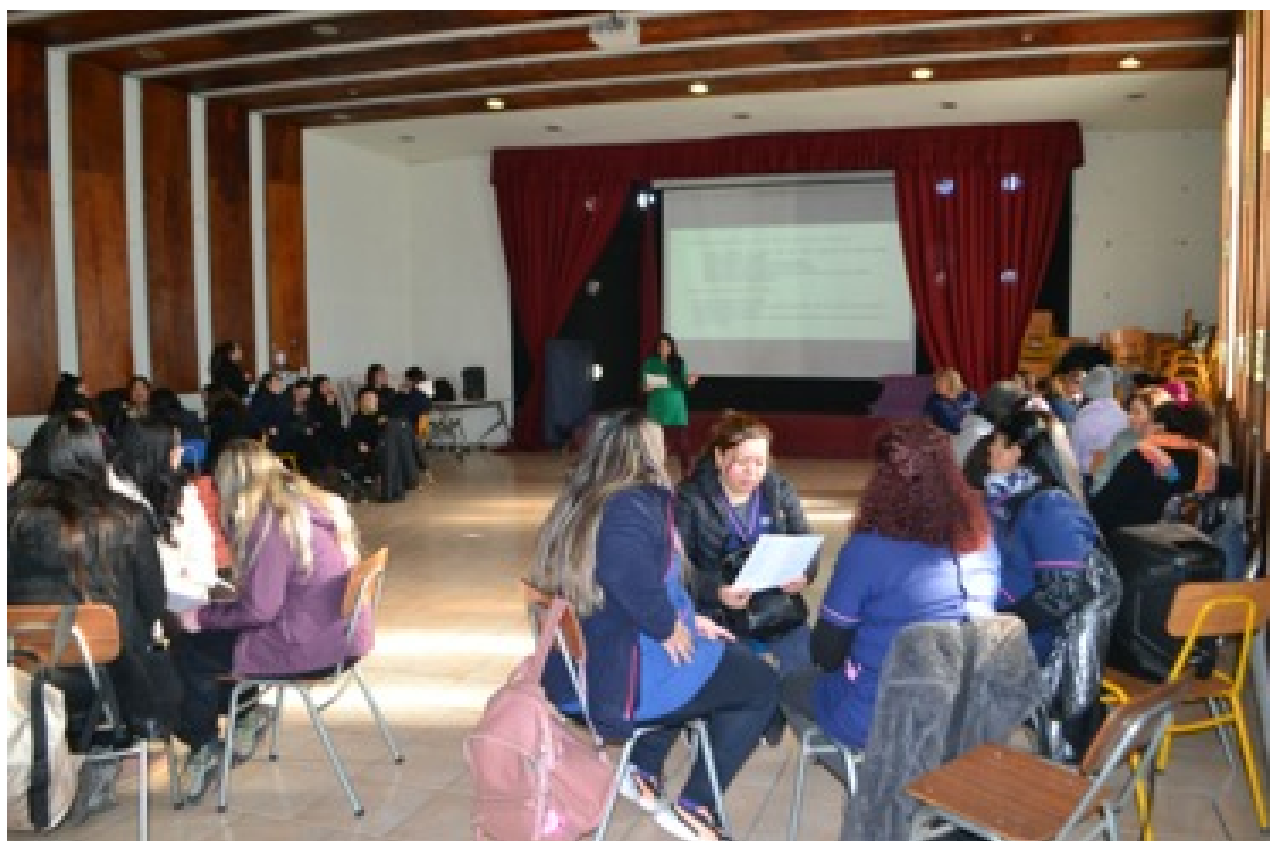
Taller de agentes de prevención psicosocial 1

El encuentro final fue ampliado a las familias del jardín, vecinos/as y a nuestras familias y se realizó en el Centro Emprendedor FIBRA, fundación que nos ha regalado numerosas oportunidades culturales.