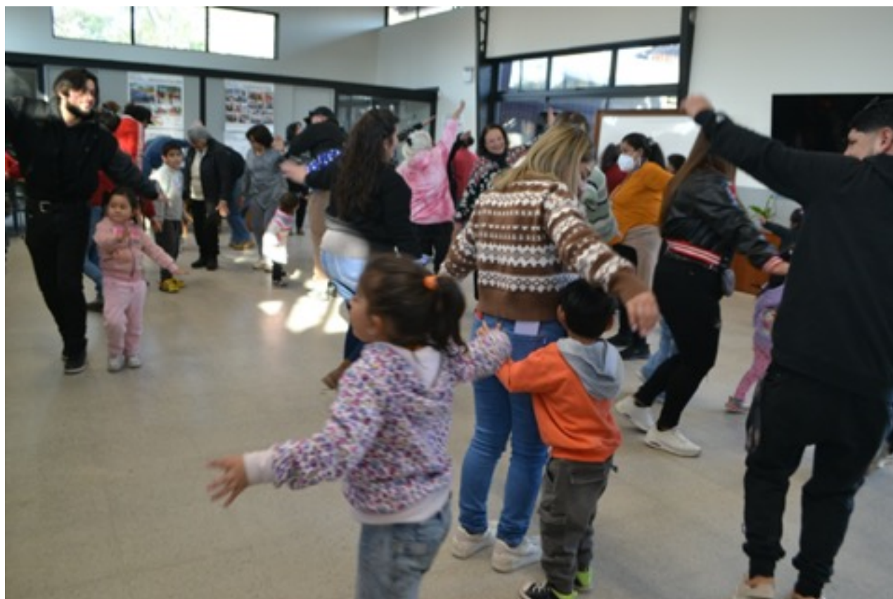
Taller de agentes de prevención psicosocial 2

El encuentro final fue ampliado a las familias del jardín, vecinos/as y a nuestras familias y se realizó en el Centro Emprendedor FIBRA, fundación que nos ha regalado numerosas oportunidades culturales.